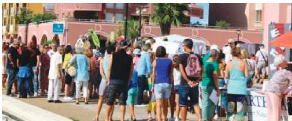
Farandole des associations