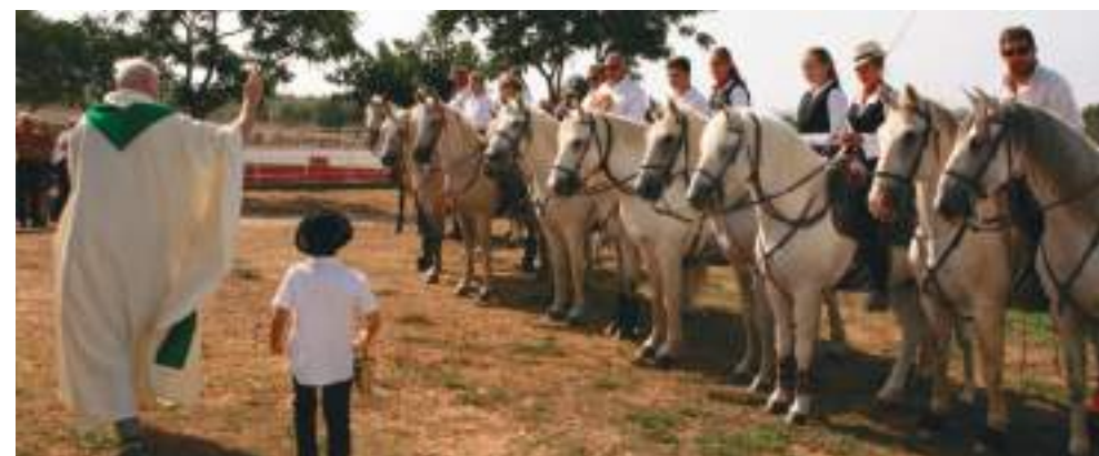
Journée à l'ancienne